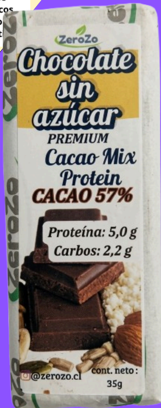
TABLA NUTRICIONAL MIX PROTEIN