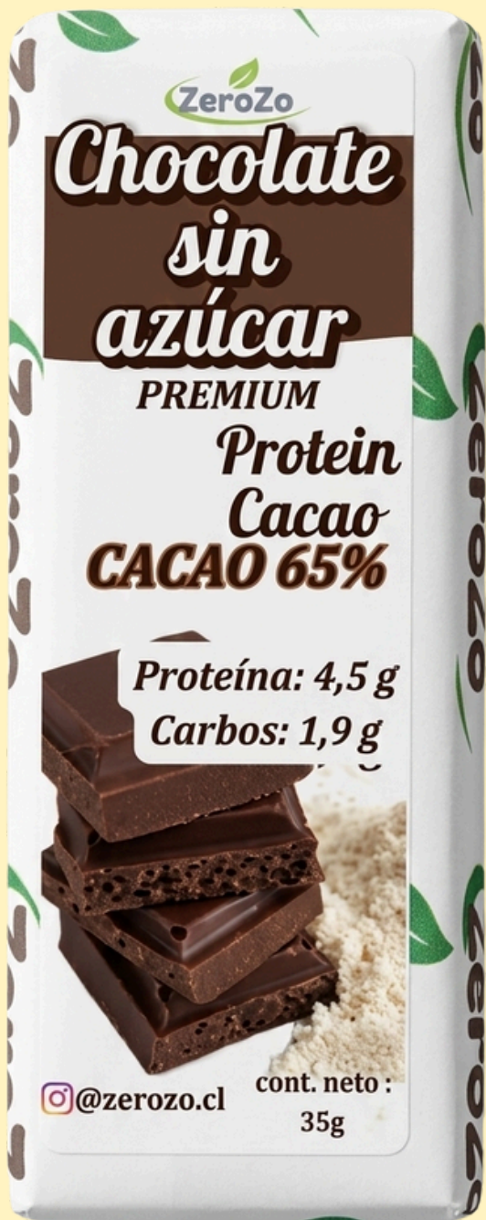
TABLA NUTRICIONAL CACAO PROTEIN